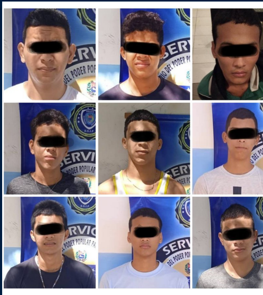
Efecto Cocuyo. (10 de septiembre de 2021). "Se fugan 21 adolescentes del retén de Los Cocos en Nueva Esparta"

La Ley Orgánica para la Protección del Niño, Niña y Adolescente (LOPNNA), que entró en vigencia el 1 de abril de 2000, establece en forma explícita que solo se podrá privar de su libertad al joven infractor (adolescente), cuando se cometa algunos de los siguientes delitos: homicidio, lesiones gravísimas, violación, robo agravado, secuestro, tráfico de drogas, robo o hurto de vehículos automotores