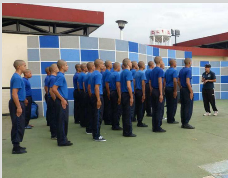
MPPSP. (26 de febrero de 2016). "En Barinas Adolescentes en Conflicto con la Ley Penal participan en el "Plan Delfines de la Patria"

La legislación venezolana establece que, al cumplir la mayoría de edad, los jóvenes infractores deben ser reubicados o trasladados en centros penitenciarios, indistintamente de que el delito se siga llevando por los tribunales de responsabilidad penal del adolescente.